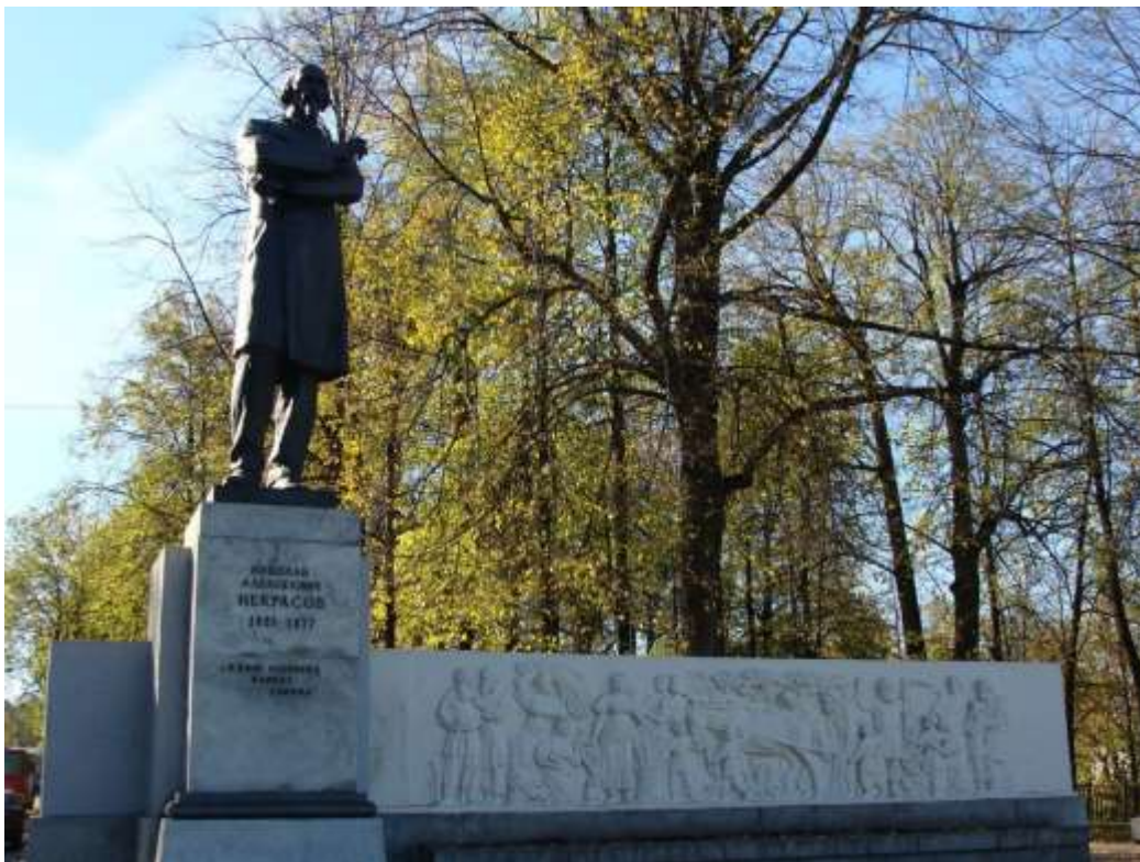
Памятник Николаю Алексеевичу Некрасову в Ярославле

Великий поэт жил и учился в Ярославле на протяжении многих лет. Именно здесь он полюбил Волгу, посвятил ей немало строк. Здесь он черпал вдохновение. И здесь благодарные жители Ярославля увековечили память о нем.