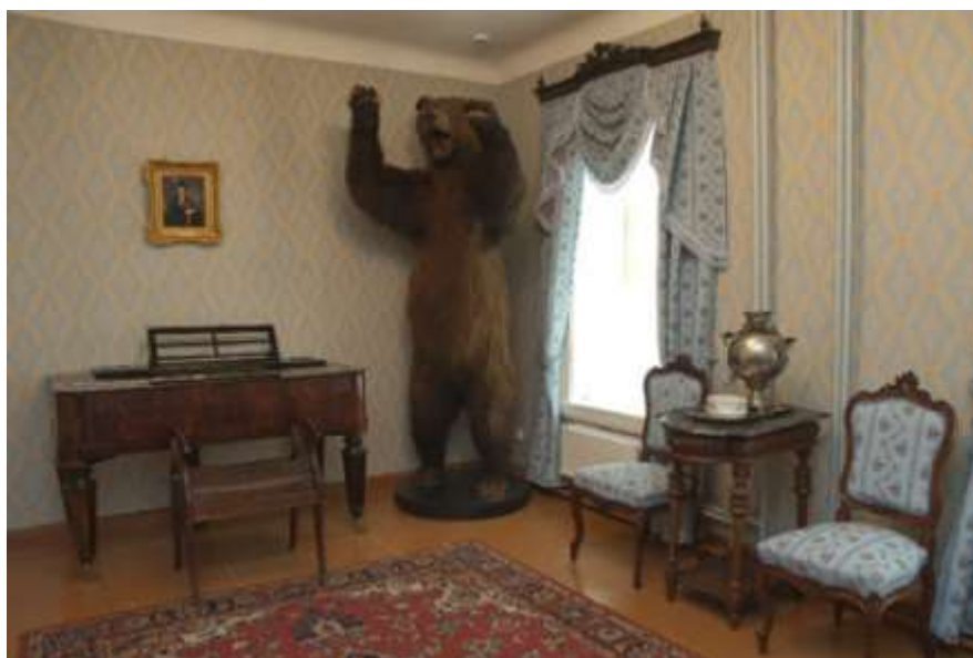
Музей – усадьба Н.А. Некрасова в Чудовской Луке