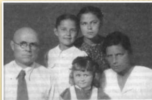
Семья в полном составе, 1950 г.