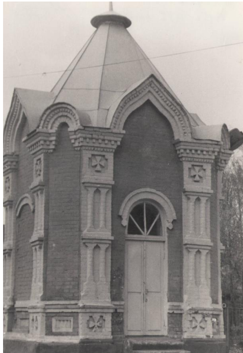
70-е годы XX века